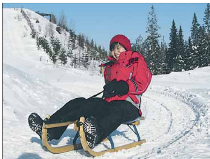
Paljakassa pääsee laskemaan yli kilometrin matkan alas huikeaa jalaskelkkamäkeä.

1200 metriä pitkä rata mutkittelee mahtavien maisemien saattamana Pankkubaarin nurkilla Skibörrin edustalle. Vastaavanlaista