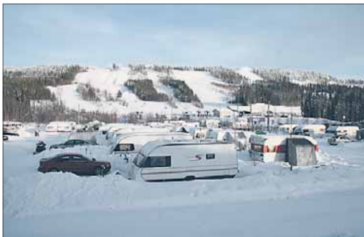
Vuoden 2007 karavaanarialueeksi valittu Paljakan hiihtokeskus on ykköstuotteensa laskettelun rinnalla panostanut myös muihin palveluihinsa.