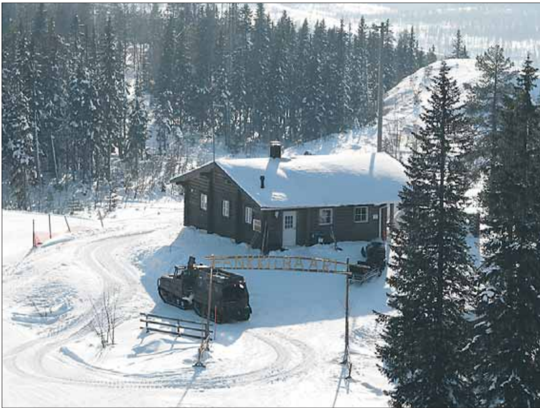
Paljakan rinteiden yläosassa sijaitsevan Pankkubaarin nimi juontuu siitä, että kuljetus baariin ja sieltä takaisin tapahtuu armeijan vanhalla telakuorma-autolla.

Tiedustelut: Hiihtokeskus Paljakka Oy Puh. (08) 755 120